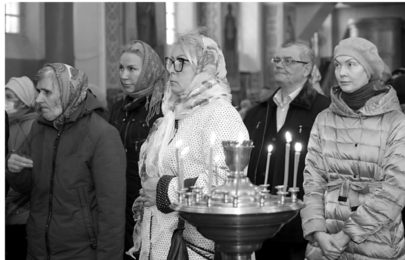
Прихожане. Успенский кафедральный собор. г. Бийск. Благовещение, 7 апреля 2021 г.