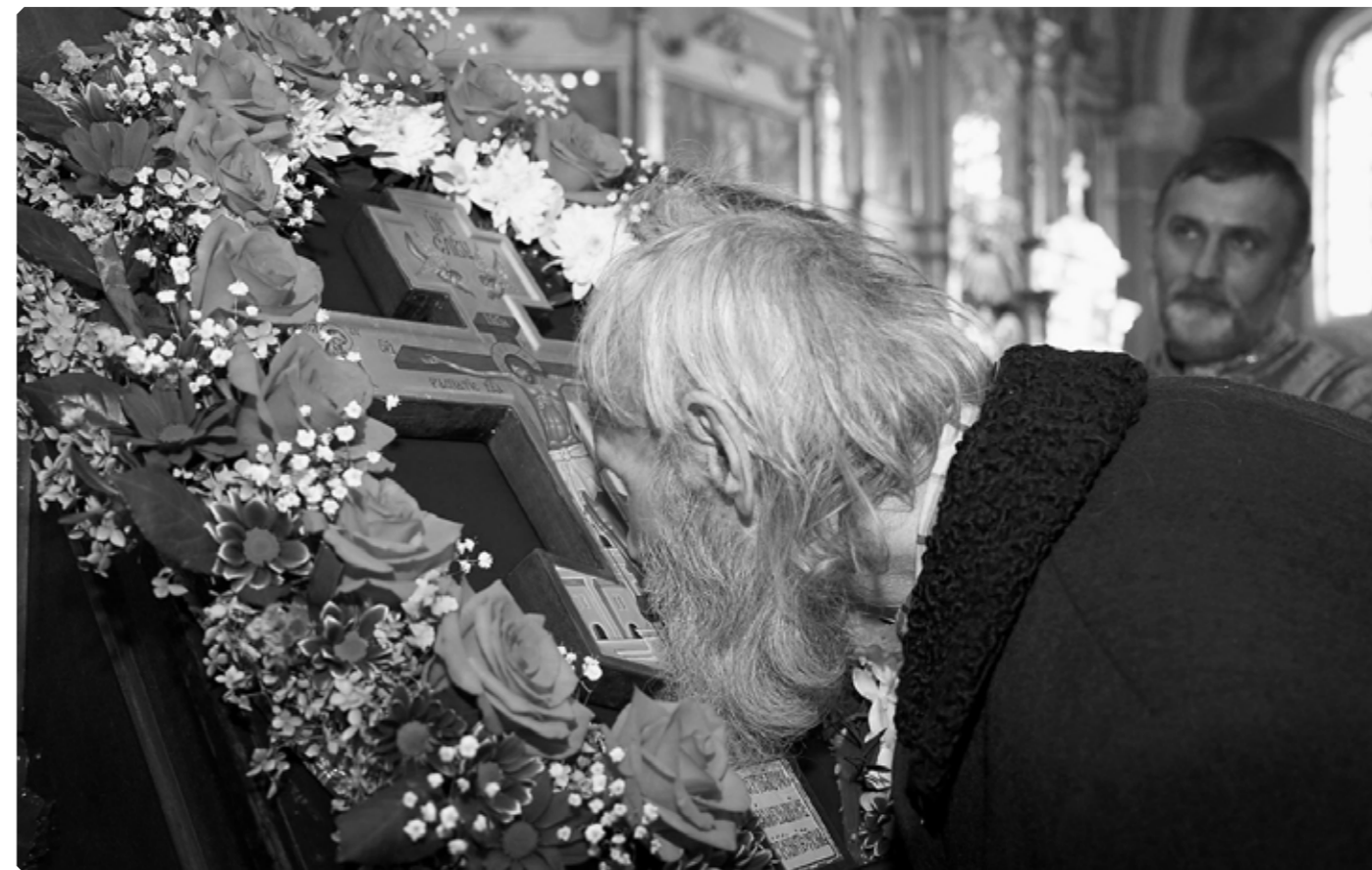
Крестопоклонная неделя. Успенский кафедральный собор города Бийска. 4 апреля 2021 г.

Много лет назад в нашей семье произошел удивительный случай. Помню его в мельчайших деталях, будто бы всё было только вчера. Жарким июльским утром мы приехали со своей дачи на пару дней в город. Дети, с самого начала летних каникул жившие в деревне,