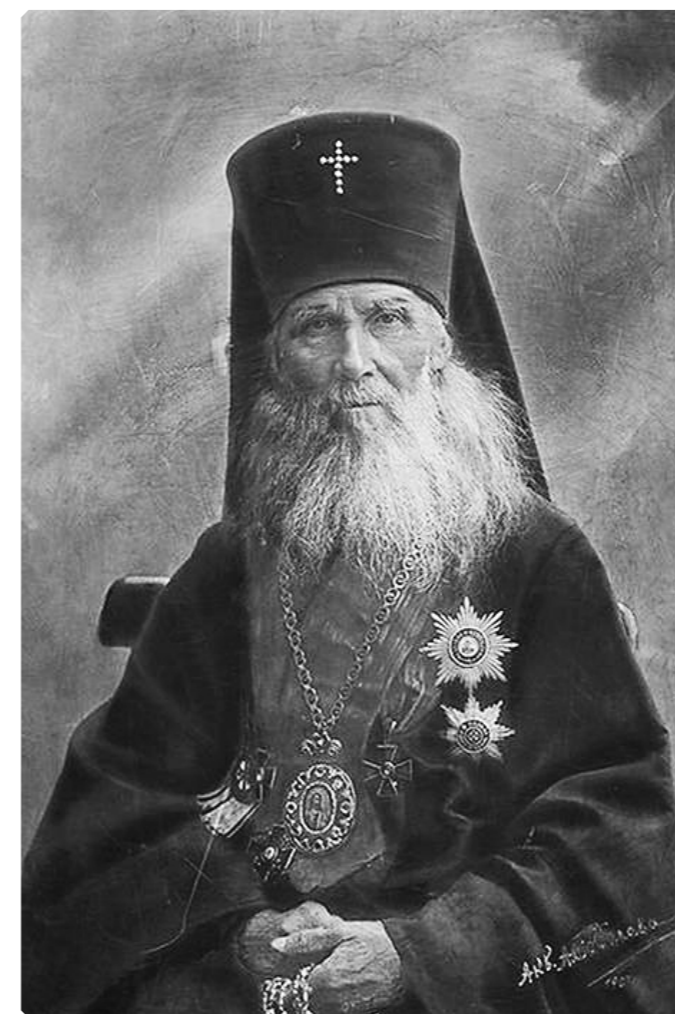
Высокопреосвященный Макарий, Томский архиеп. 1907 г. Томск. Фотобумага. Картон. Ретушь: акварель А. Соболева. ТОКМ