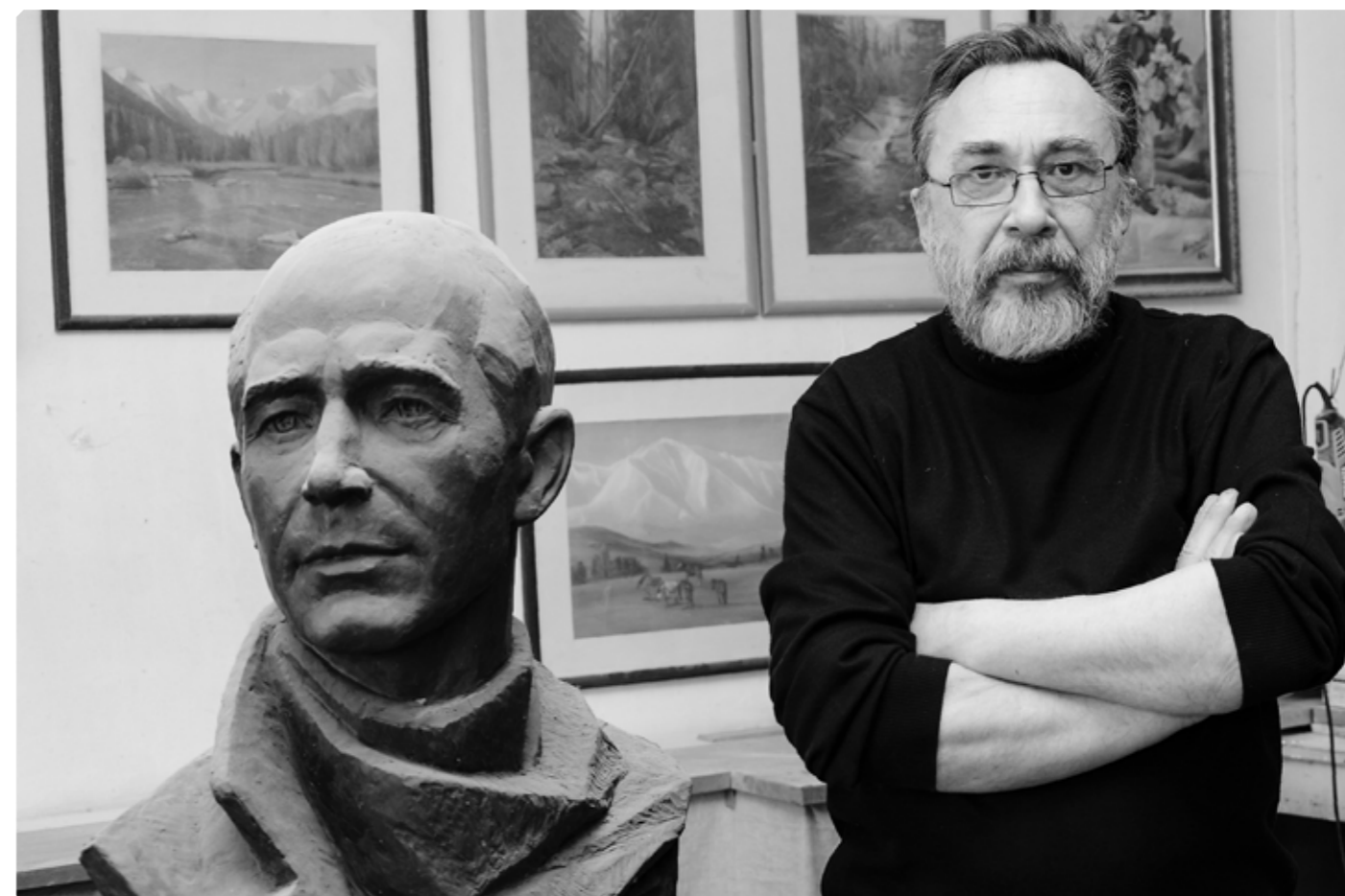
В мастерской скульптора. Автор с бюстом поэта Николая Рубцова.