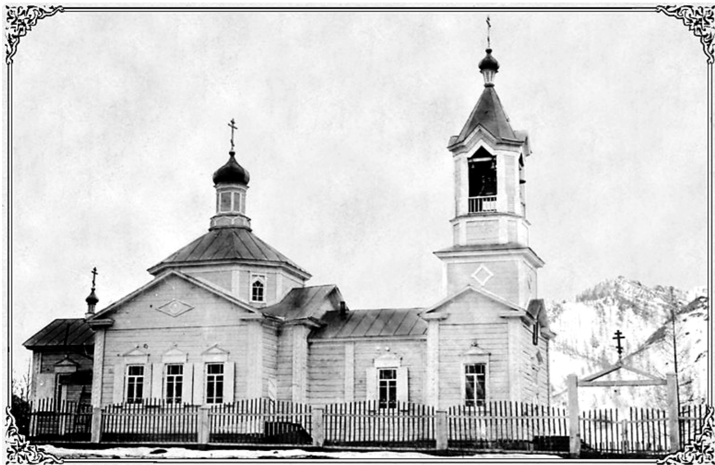
Храм Архангела Михаила в селе Мьюта. Начало XX в. АГКМ. Фото с сайта прот. Георгия Крейдун. http://kreydun.web-box.ru/

Марушкинского, благоч. № 28; ...21. Митропольский Симеон, священник церкви при Бийском городском училище...»