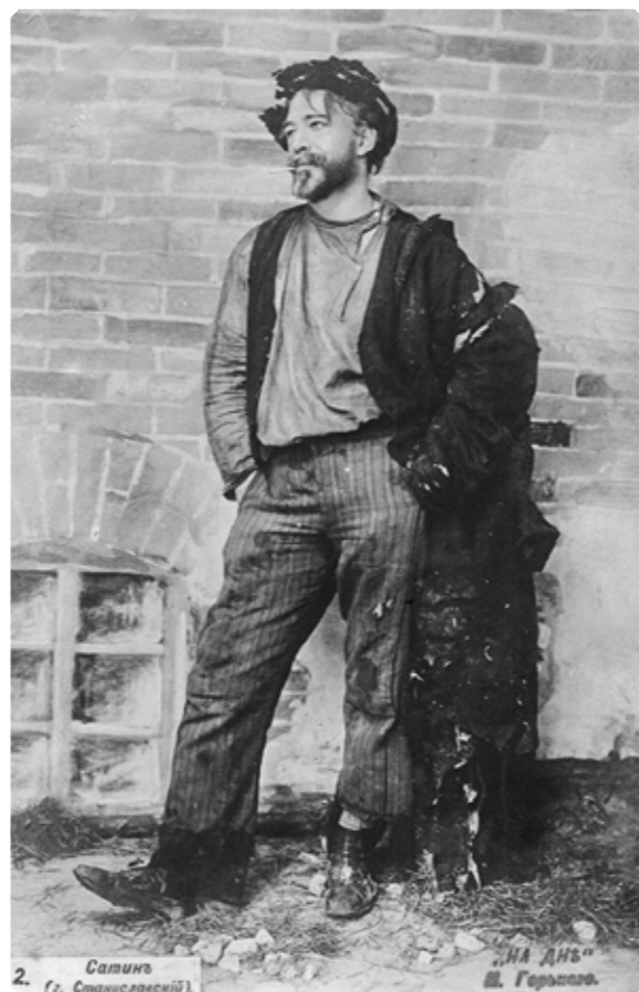
Константин Станиславский в роли Сатина в пьесе М. Горького «На дне». 1902–1903 гг. Москва

Другие религии не признают этой болезни в человеке. Отвергают ее. Они считают, что человек – это здоровое семя, которое может развиваться и нормально, и ненормально. Его развитие обусловлено социальной средой, экономическими условиями, психологическими факторами, обусловлено многими вещами. Поэтому человек может быть и хорошим, и плохим, но сам он по своей природе хорош. Вот главный антитезис нехристианского сознания. Я не говорю нерелигиозного, там и говорить нечего, там вообще: «Человек – это звучит гордо». (Помните слова