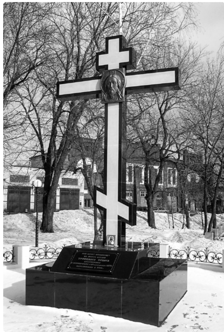
Мемориальный поклонный крест, установленный на месте алтаря разрушенного градо-Бийского Свято-Троицкого собора. Образ Спаса Нерукотворного выполнен С.А. Морозовым. 2011 г.

описанные великим поэтом. Но прежде, чем я задам свой вопрос о том, как родился Ваш «Пророк», мне бы хотелось представить Вас читателям журнала. Сможете ли Вы рассказать нам немного о себе?