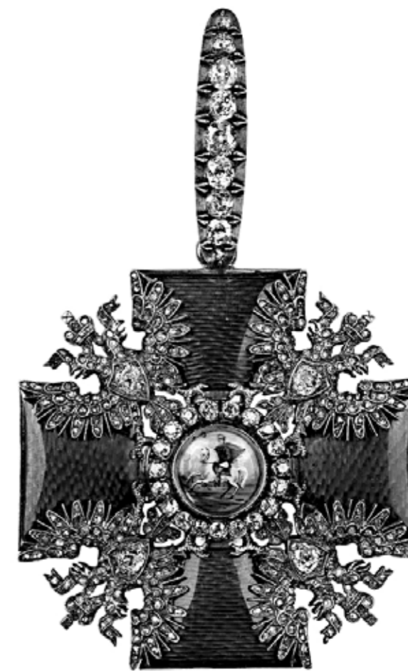
Знак Императорского ордена святого благоверного великого князя Александра Невского с бриллиантами