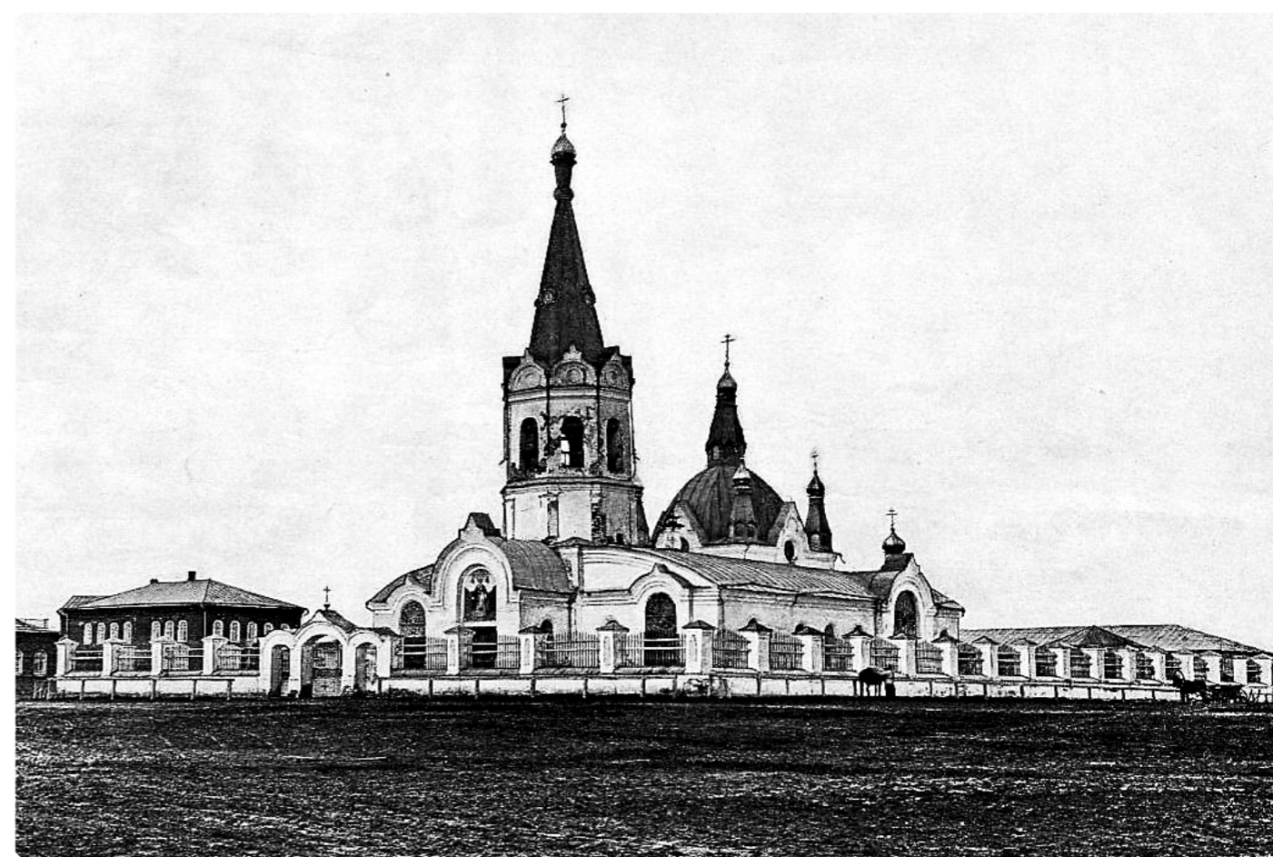
Градо-Мариинский Никольский собор (1824–1938). Фото 1899 г.

«Томские епархиальные ведомости». – 1893 г. – № 13. – Официальный отдел. – С. 4. Фрагмент