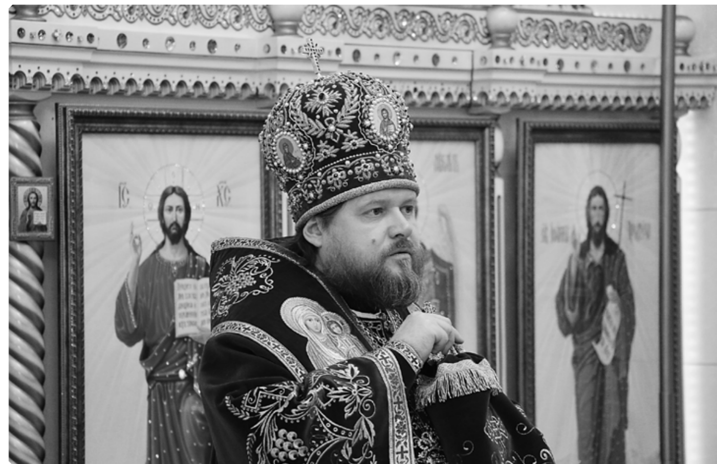
Проповедь Преосвященного Серафима. Покровский храм. г. Бийск. ПО «Сибприбормаш». Благовещение, 7 апреля 2020 г.

В этом году накануне Благовещения дощечка в Бийске точно не зазвенела бы: 7 апреля с утра до самого вечера непрерывно шел дождь, и прятывшееся в серой пелене солнце робко выглянуло только к концу дня. На удивление, ненастье не раздражало: на душе, как и в окружающей природе, было тихо и благостно.