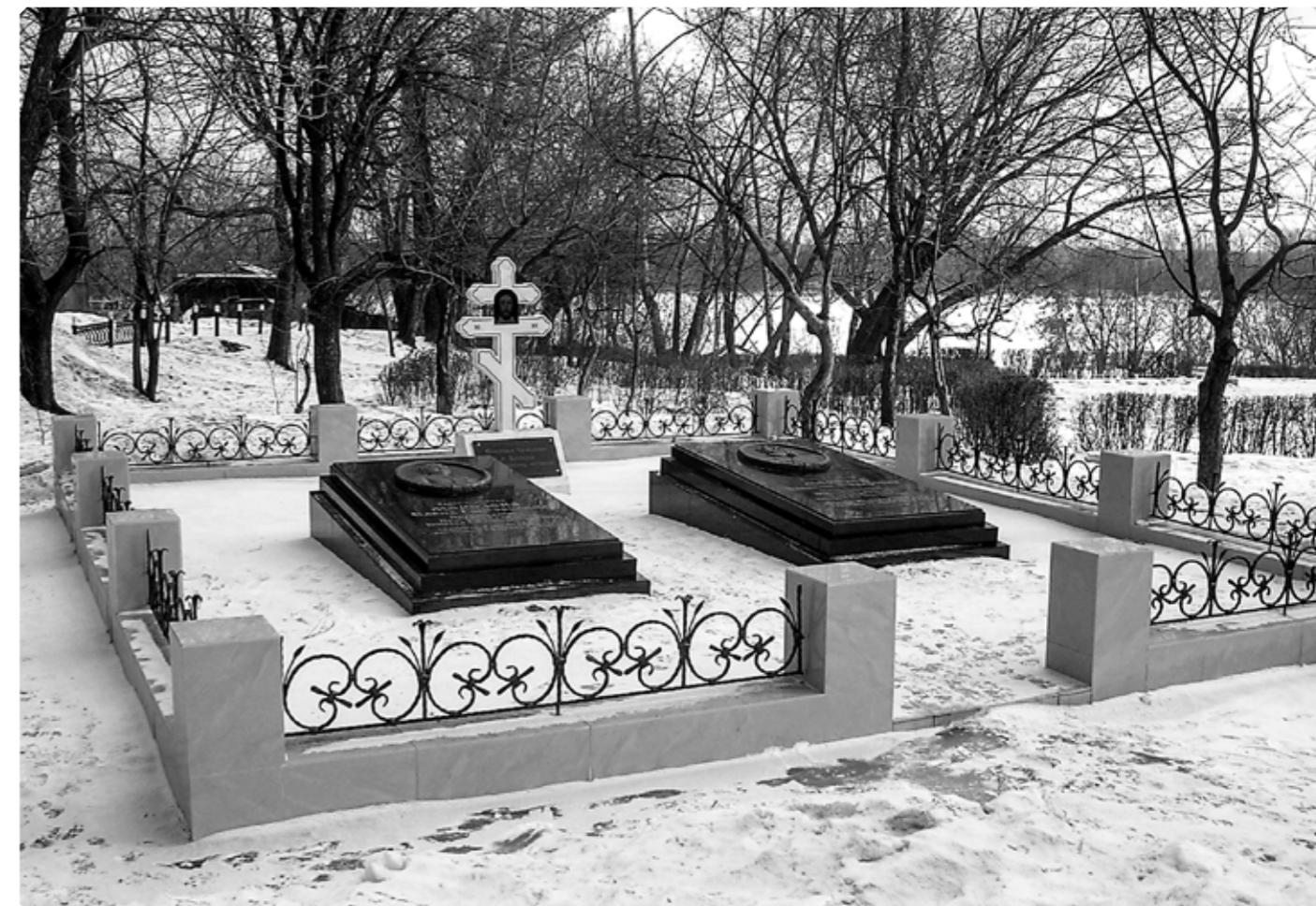
Надгробия на могилах Бийских 1-й гильдии купцов, попечителей Алтайской духовной миссии А.Ф. и Е.Г. Морозовых. Накладные портретные барельефы купцов выполнены С.А. Морозовым. 2012 г.

– Так или иначе, всё это – работы, выполненные на заказ, что не умаляет, безусловно,