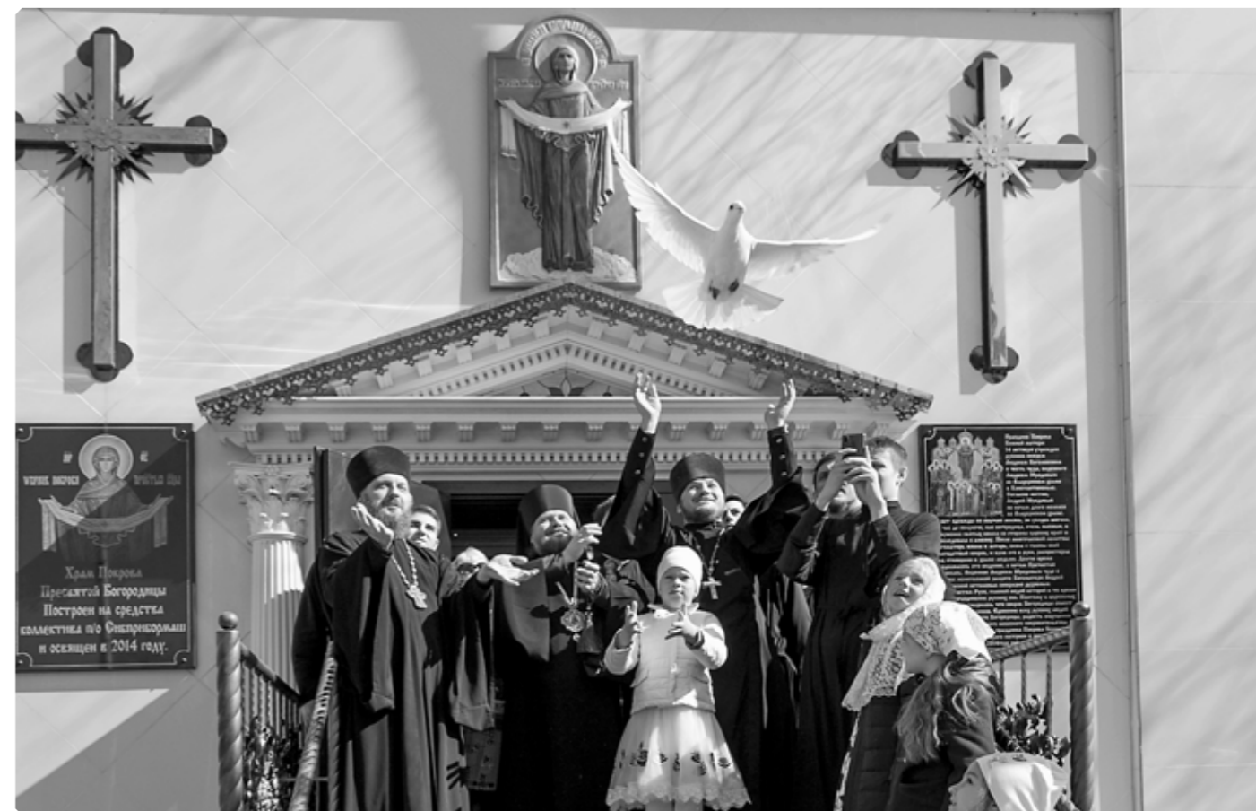
Выпускание голубей. Покровский храм. г. Бийск. ПО «Сибприбормаши». Благовещение, 7 апреля 2020 г.