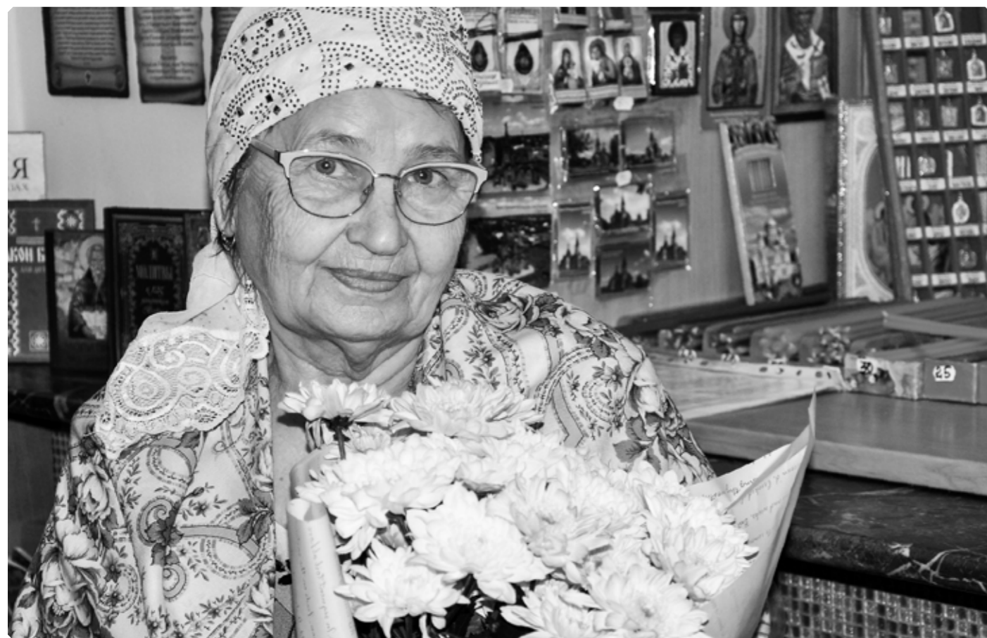
Перед встречей архиерея. Храм великомученицы Екатерины. с. Сростки. Благовещение, 7 апреля 2019 г.