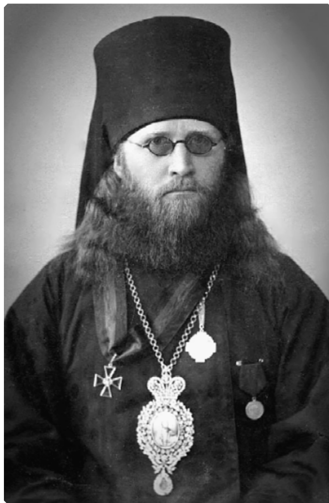
Преподобный Макарий (Павлов), епископ Бийский. Начало XX в. МАДМ