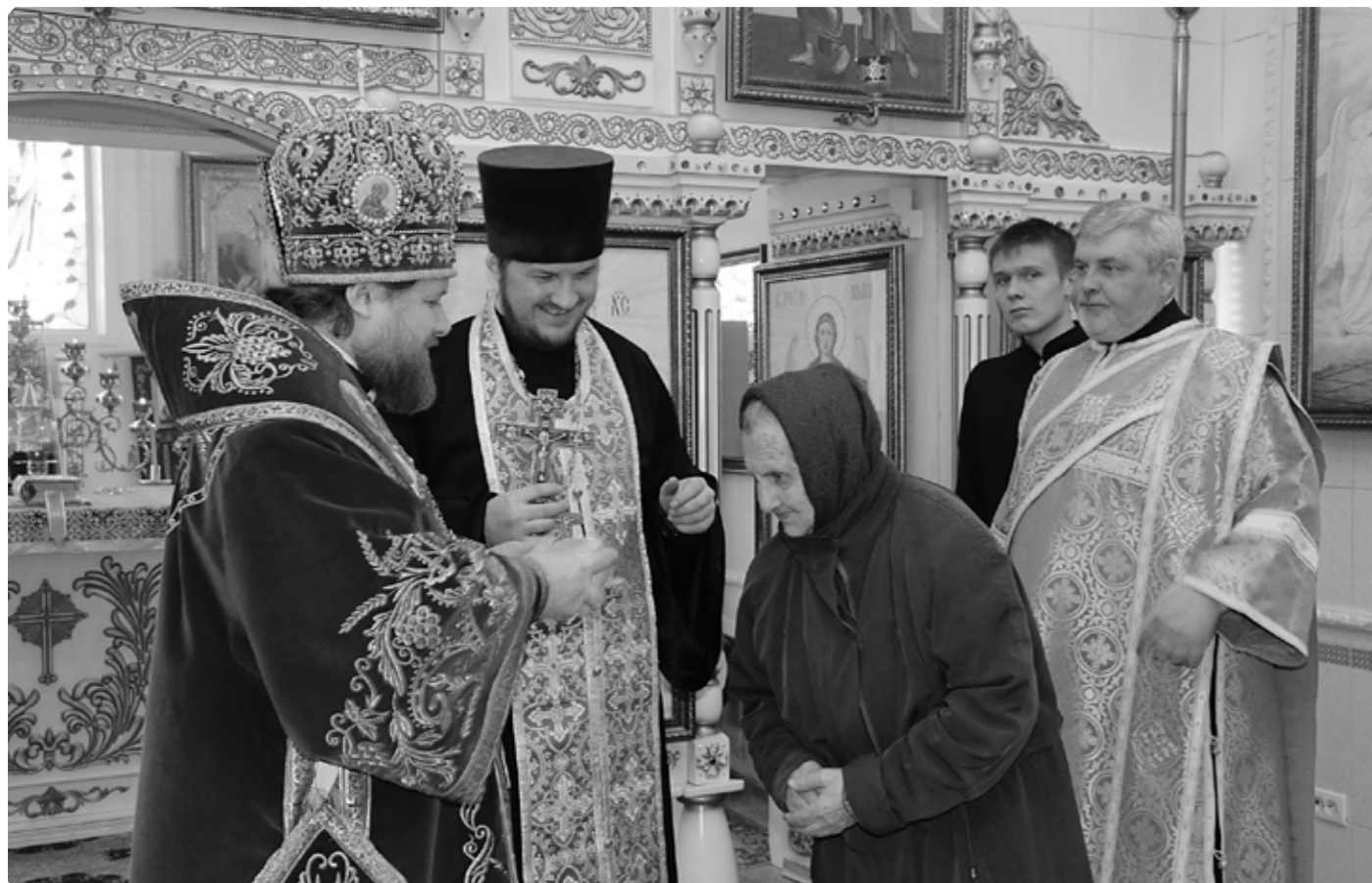
Благословение Владыки. Покровский храм. г. Бийск. ПО «Сибприбормаши». Благовещение, 7 апреля 2020 г.

душой свободы от рабства греху, свободы, «которая дарована пришествием в мир Господа и Спасителя нашего Иисуса Христа». С древних времен белый голубь является символом благодатного действия Святого Духа, а его белоснежные крылья – символом чистоты Пресвятой Девы Марии.