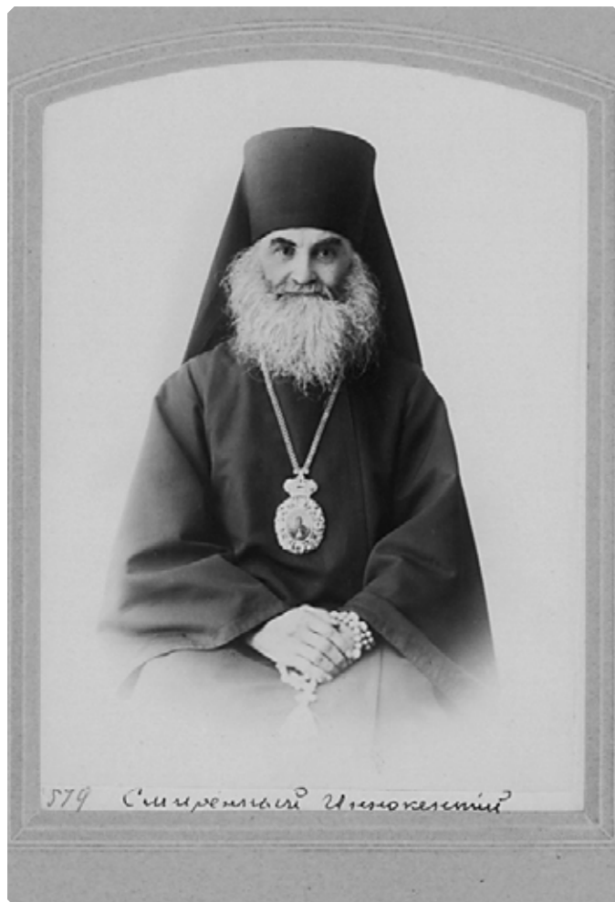
Преподобный Иннокентий (Солодчин), епископ Приамурский и Благовещенский (1842–23.10.1919)